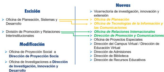
4. ESTUDIO TÉCNICO REDISEÑO INSTITUCIONAL – CONCLUSIONES INFORME FINAL