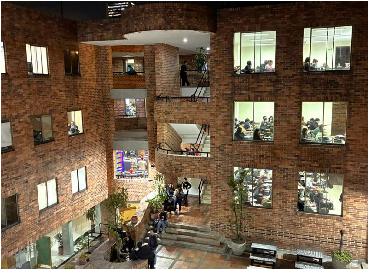
Durante una semana los nuevos estudiantes de pregrado conocieron todos los servicios institucionales que ofrece la Universidad.

El Ministerio de Educación Nacional renovó por siete años el Registro Calificado del programa profesional de Administración de Empresas Comerciales. La actualización incluye ajustes en el plan de estudios, reducción de créditos y un título profesional inclusivo.