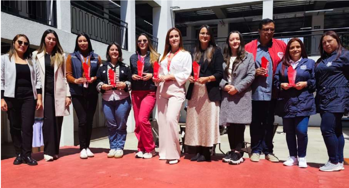
Grupo de representantes de instituciones reconocidas por su labor en beneficio de la salud mental del municipio de Funza, entre ellas la Universidad Colegio Mayor de Cundinamarca.

La Alcaldía de Funza reconoció a la Universidad Colegio Mayor de Cundinamarca por su trabajo sostenido en el fortalecimiento de la salud mental en el territorio. Durante 2025, la Institución desarrolló acciones de atención, promoción y prevención.