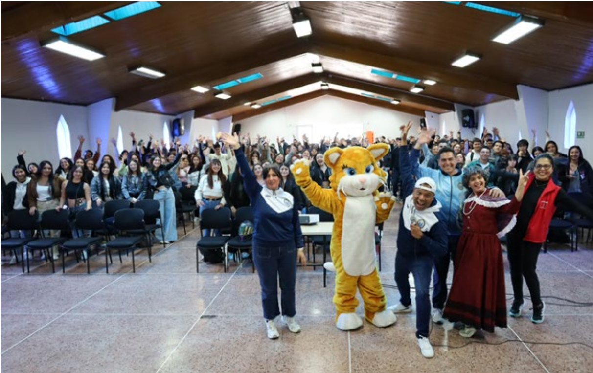
Las inducciones realizadas el 14 de julio en la sede principal convocaron a 557 nuevos estudiantes que entraron en contacto con las directivas de la Universidad.

Cerca de 1.320 nuevos estudiantes participaron en las actividades de la semana de inducciones de la Universidad, las cuales incluyeron sesiones presenciales y virtuales, recorridos por las sedes y orientación institucional. También se realizaron jornadas especiales para madres, padres y acudientes.