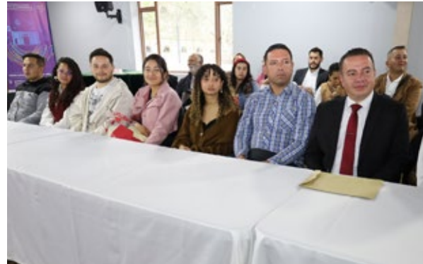
Grupo de estudiantes que irán a universidades de América Latina en modalidad de semestre académico.

Cundinamarca continúa consolidándose como una Institución comprometida con la excelencia académica y la proyección internacional de su comunidad universitaria.