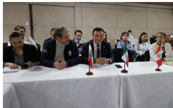
Los profesores de internacionalización de las facultades y los decanos entregaron mensajes motivadores a los estudiantes.

De este grupo, 19 estudiantes realizarán semestre académico en instituciones de Argentina, Chile, México y Perú; tres