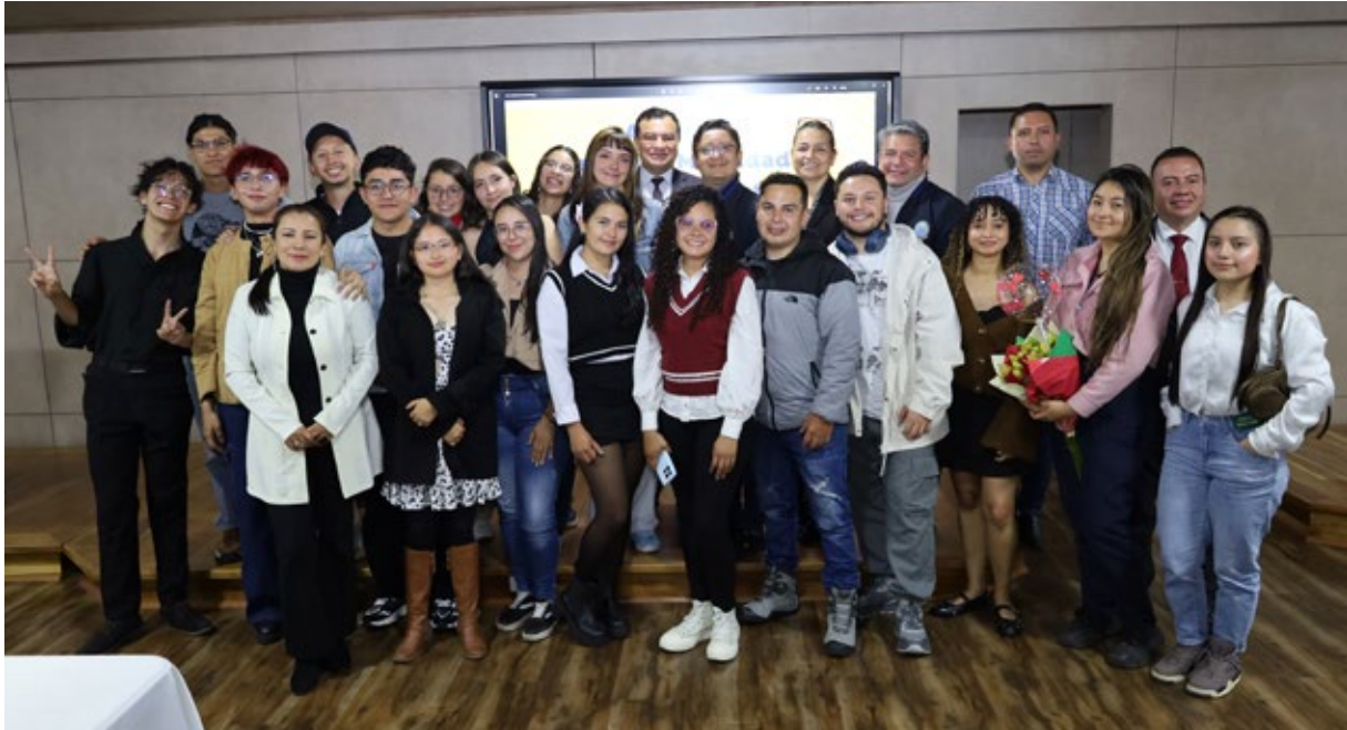
La Oficina de Relaciones Interinstitucionales (ORI) organizó un encuentro con los 24 estudiantes de movilidad académica saliente internacional, para guiarlos sobre esta experiencia, en diversos temas.

La Institución sigue fortaleciendo su política de internacionalización con dos grandes hechos que marcan el inicio del segundo semestre de 2025: la salida al exterior de 24 estudiantes y la llegada de cinco pasantes internacionales a nuestras aulas.