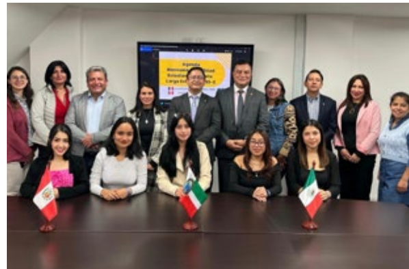
La Universidad les dio la bienvenida a las estudiantes provenientes de Perú y México.