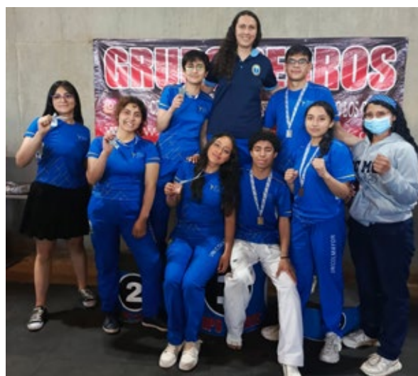
Participantes de los torneos interuniversitarios Cerros.

En múltiples disciplinas y escenarios, tanto internos como externos, representantes de la comunidad universitaria cosecharon logros deportivos. Entre los más destacados se encuentra el desempeño del equipo de taekwondo, que obtuvo