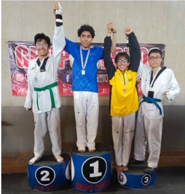
Ganadores del equipo de taekwondo.

un total de 7 medallas en los Juegos Cerros 2025-1: 1 de oro, 4 de plata y 2 de bronce, en modalidades de "combate" y "poomsae", tanto femenino como masculino. Estudiantes de los programas de Diseño Digital y Multimedia y de Bacteriología y Laboratorio Clínico fueron protagonistas de estas victorias.