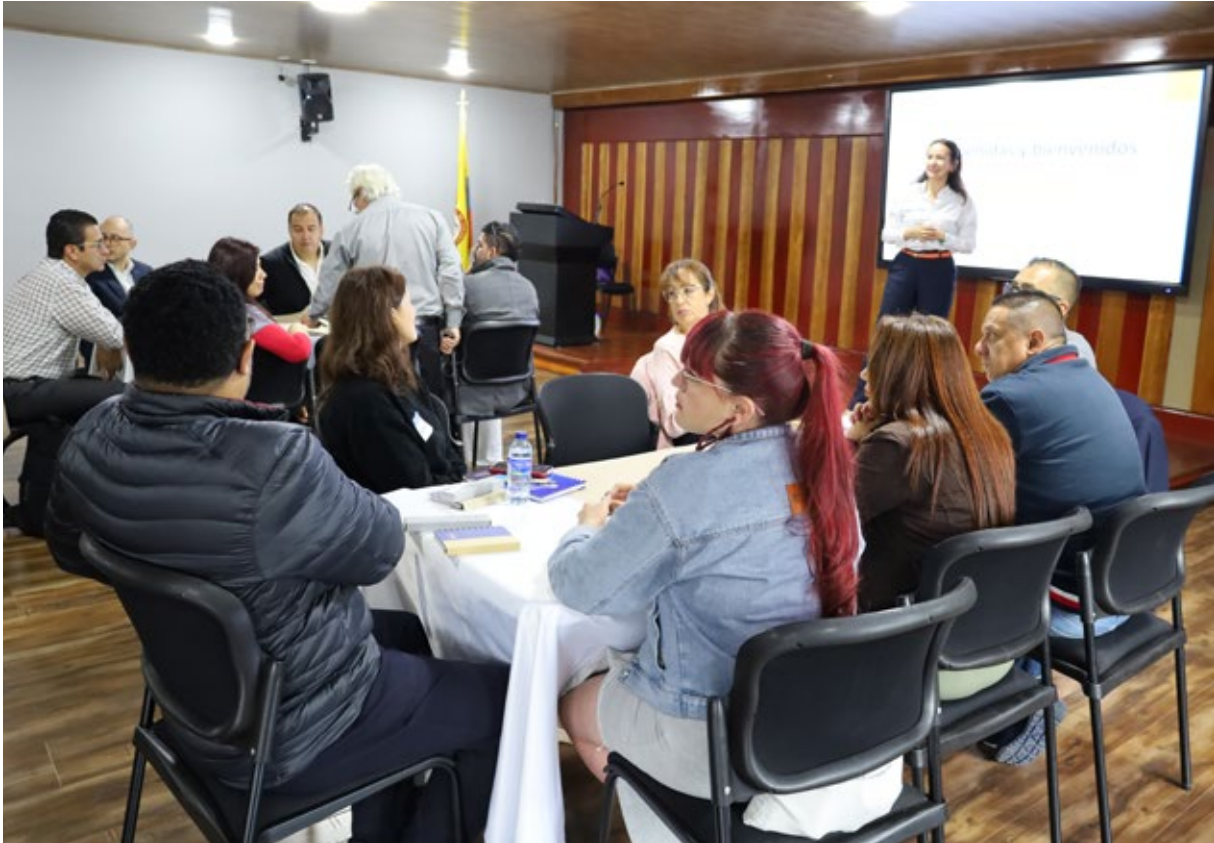
Durante los primeros meses de 2025, todas las dependencias de la Universidad se comprometieron con la construcción del nuevo Plan de Desarrollo Institucional.

El Consejo Superior Universitario aprobó el nuevo Plan de Desarrollo Institucional 2025–2029, el cual consolida los avances recientes impulsados desde Rectoría e impulsa una visión estratégica basada en inclusión, transformación digital, bienestar y sostenibilidad.