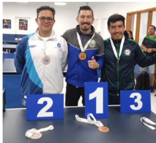
Ganadores torneo tenis de mesa.