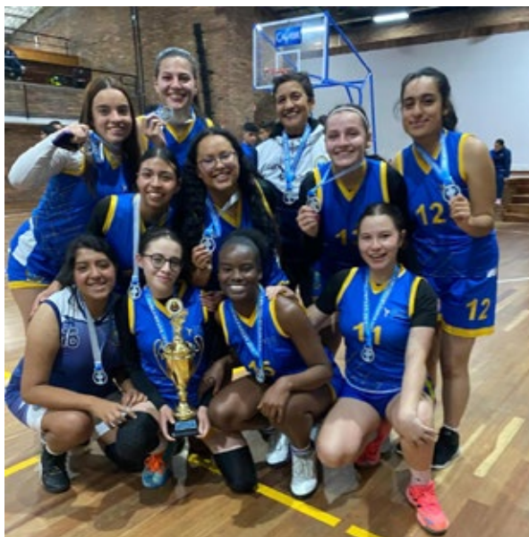
Integrantes del equipo baloncesto de la Universidad Colegio Mayor de Cundinamarca, segundo puesto en la Copa Bogotá.