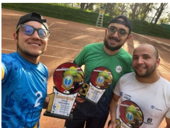
Integrantes del equipo de tenis de campo

Gracias a estos esfuerzos, hoy la Institución no solo forma profesionales íntegros, sino también personas que, desde el deporte, construyen comunidad, fortalecen su salud y llevan en alto el nombre de la Universidad.