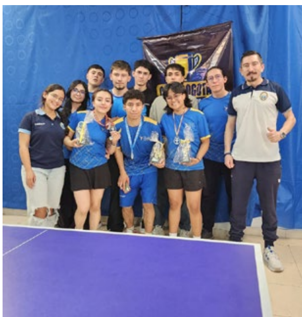
Representantes del equipo de tenis de mesa.