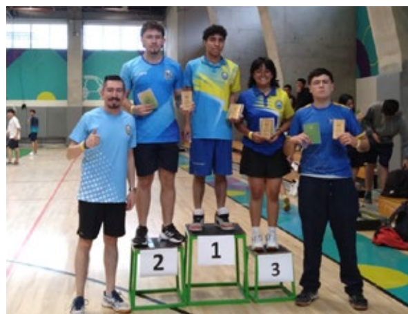
Ganadores torneo tenis de mesa.