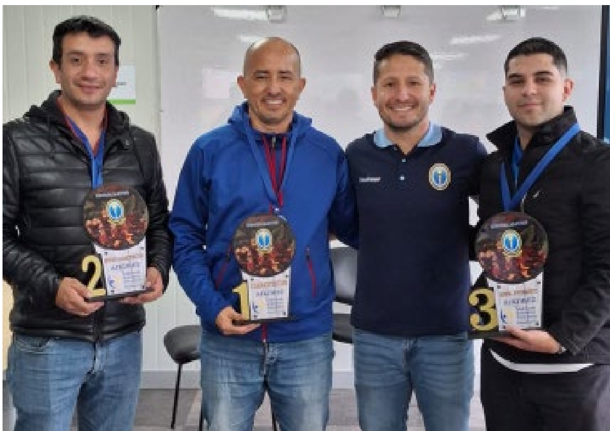
Estudiantes ganadores en uno de los torneos internos de ajedrez.

Estudiantes y funcionarios administrativos brillaron en el primer semestre de 2025 en disciplinas como taekwondo, ajedrez, baloncesto, atletismo y tenis de campo. Estos logros reflejan la apuesta institucional por el bienestar, la recreación y el sentido de comunidad.