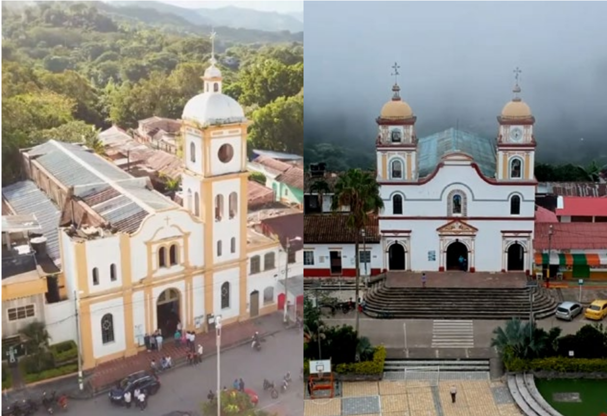
Viotá, San Juan de Rioseco y Villeta (en Cundinamarca), y La Plata (en el Huila) son los nuevos municipios que firmaron convenios con la Universidad Colegio Mayor de Cundinamarca.

Avanza con paso firme en la estrategia de regionalización. Nuevos convenios firmados en Cundinamarca y el Huila permitirán ampliar la oferta académica y de extensión en más municipios.