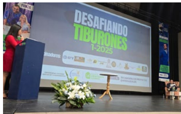
En Funza, la Facultad de Administración y Economía desarrolló el reto "Desafiando Tiburones", que convocó a emprendedores del municipio.

Durante el evento, se presentó a 'Mayo', la mascota oficial, que representará el espíritu de trabajo en equipo, la identidad y la proyección de la Universidad en todas sus actividades.