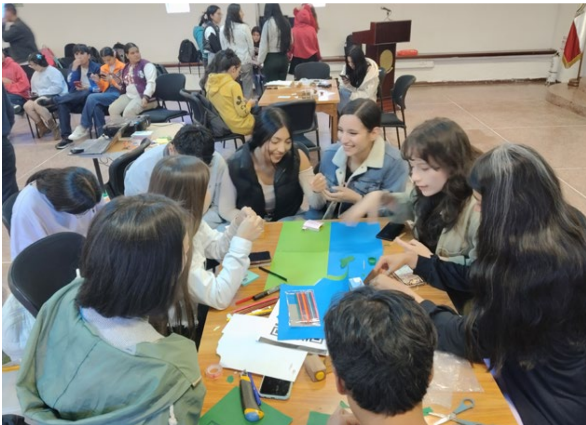
Los estudiantes tuvieron una participación activa en el "II Hackathon estudiantil de innovación ecosocial", en la semana del "Educhallenge 2025".

Durante mayo de 2025 se cumplió una nueva versión del "Educhallenge", una semana para pensar, crear y transformar la educación desde la innovación educativa, la sostenibilidad y el compromiso social.