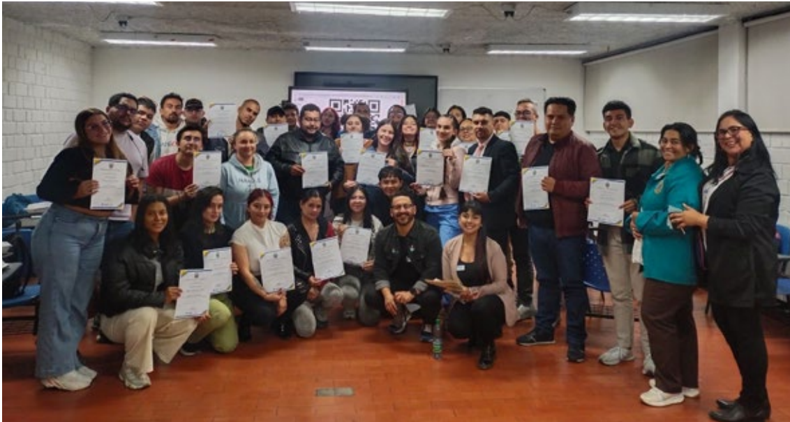
Participantes en el "Segundo encuentro de estudiantes representantes en comités asesores", en el marco de la "Semana de la docencia e internacionalización".