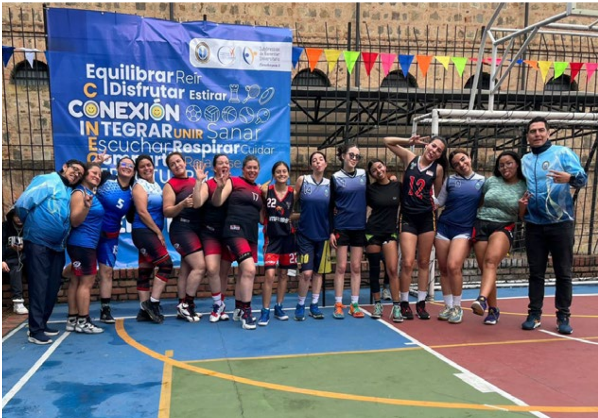
Estudiantes, docentes y funcionarios administrativos se conectaron a través del deporte y el esparcimiento.

La Universidad programó en mayo la primera Semana de la Conexión y Bien-Estar, una iniciativa que movilizó a estudiantes, docentes y administrativos en torno al deporte, la recreación y la vida saludable.