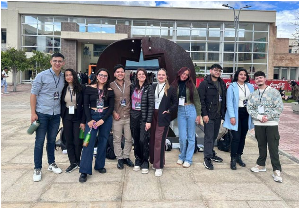
En la imagen, algunos de los estudiantes y profesores asistentes al XIII Encuentro RedColsi.

Con 28 proyectos reconocidos en la categoría de "Sobresalientes", 12 que alcanzaron la distinción de "Meritorios" y uno que obtuvo el reconocimiento al "Mejor proyecto por área", nuestros estudiantes dejaron en alto el nombre de la Universidad Colegio Mayor de Cundinamarca.