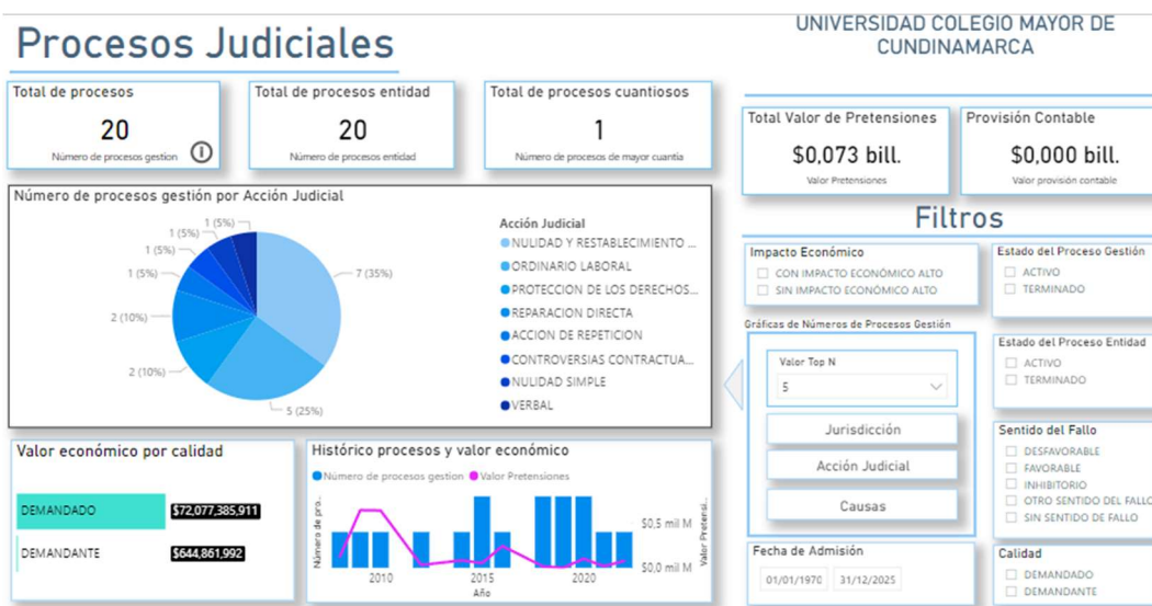
Imagen 6. Análisis procesos judiciales

Finalmente, y como un valor agregado del sistema e-KOGUI, se muestran a continuación los datos estadísticos arrojados por el aplicativo para el estudio del impacto económico en los procesos judiciales: